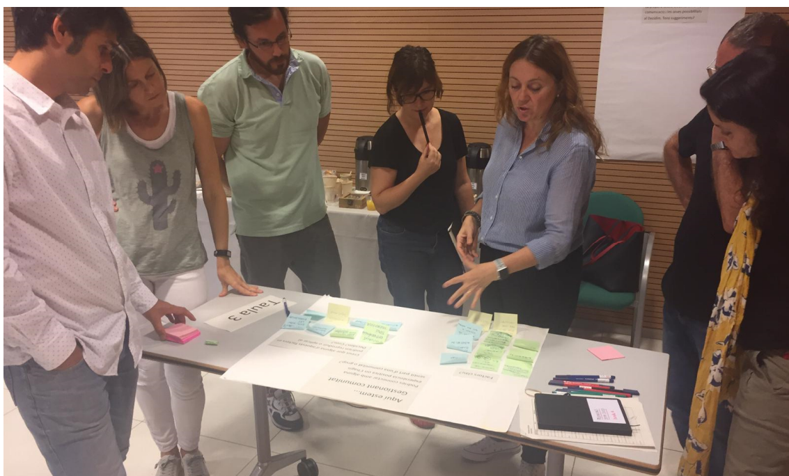
Foto del treball en grups. Elaboració pròpia