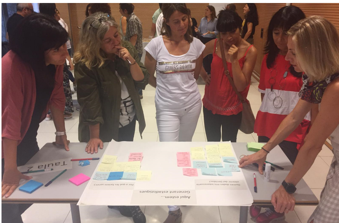
Foto del treball en grups. Elaboració pròpia